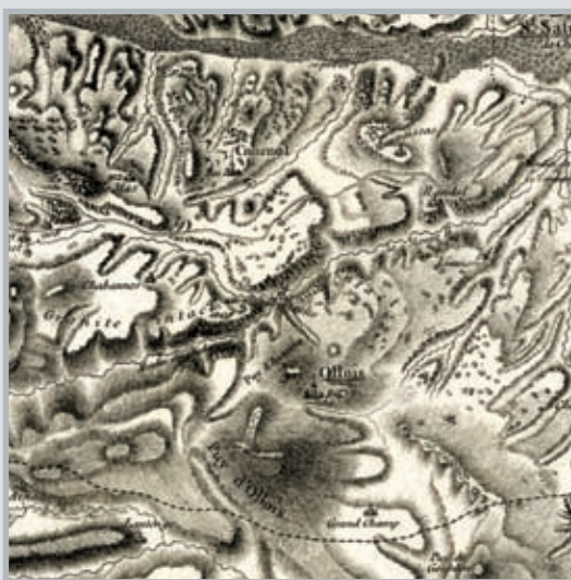
▲ 2011 - Technique mixte sur toile - 200 x 200 cm.