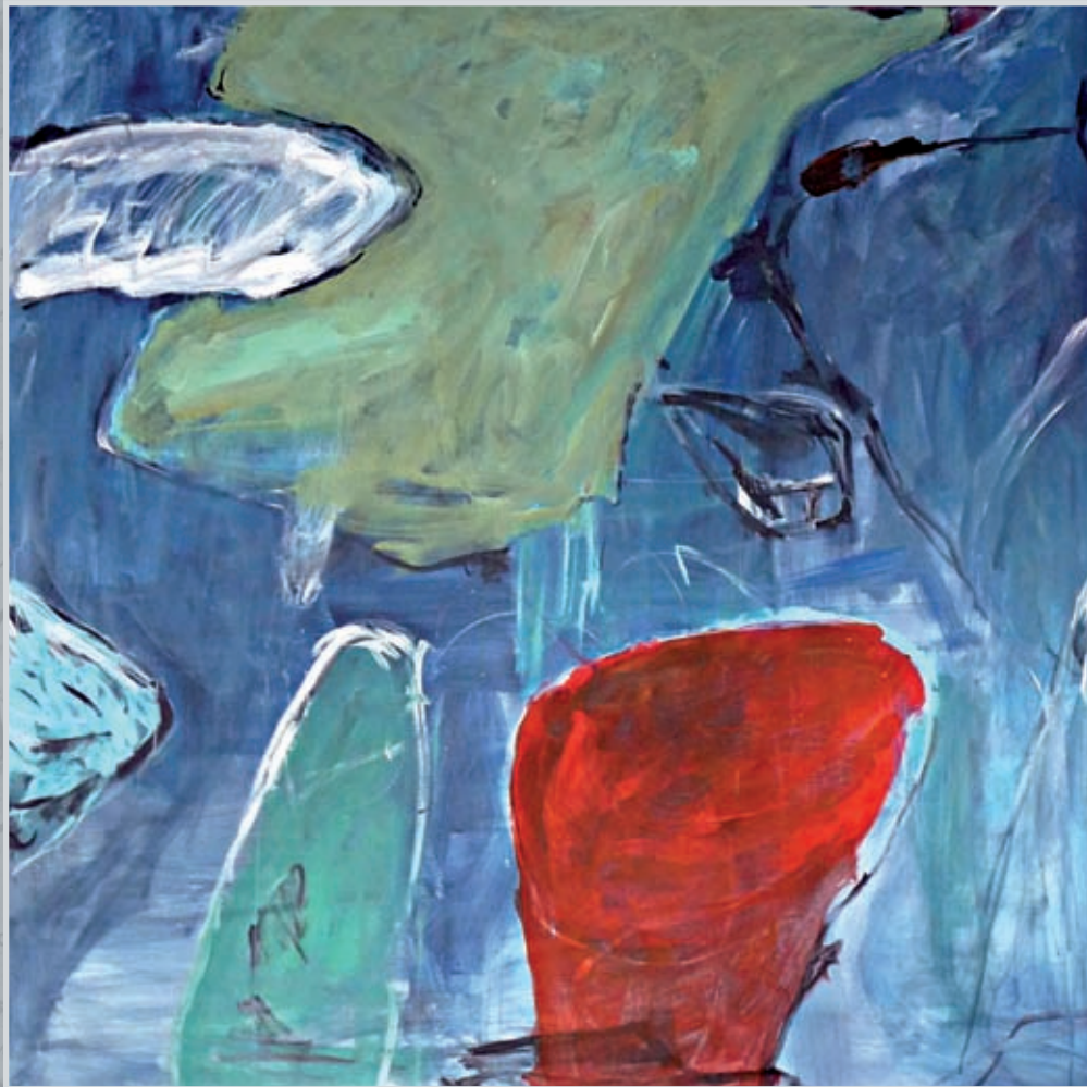
▲ 2011 - Technique mixte sur toile - 200 x 200 cm.